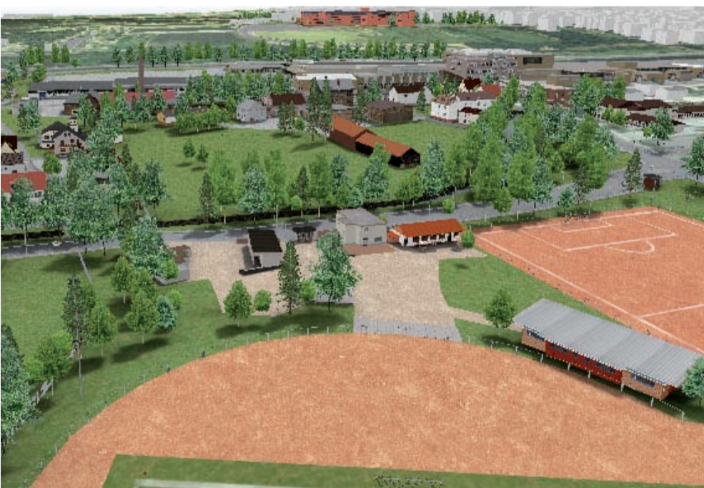
Heutige Ansicht auf den Sportplatz in der Hofheimer Strasse – emissionsfreies und attraktives Sportgelände für Vereine und Schulen!