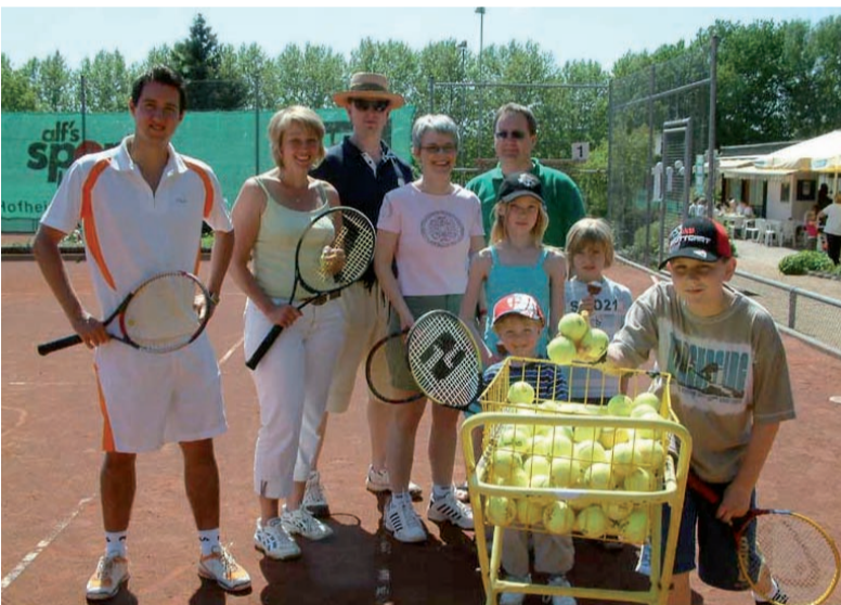
Das Gelände des KTC heute freizeit- und erholungsgerecht im Krifteler Grüngürtel gelegen.

Der Krifteler Tennis-Club ist mit knapp 500 Mitgliedern einer der größten Vereine Kriftels. Durch eine intensive Jugendarbeit, eine gesunde Mischung aus leistungsorientiertem und „Freizeit“-Tennis