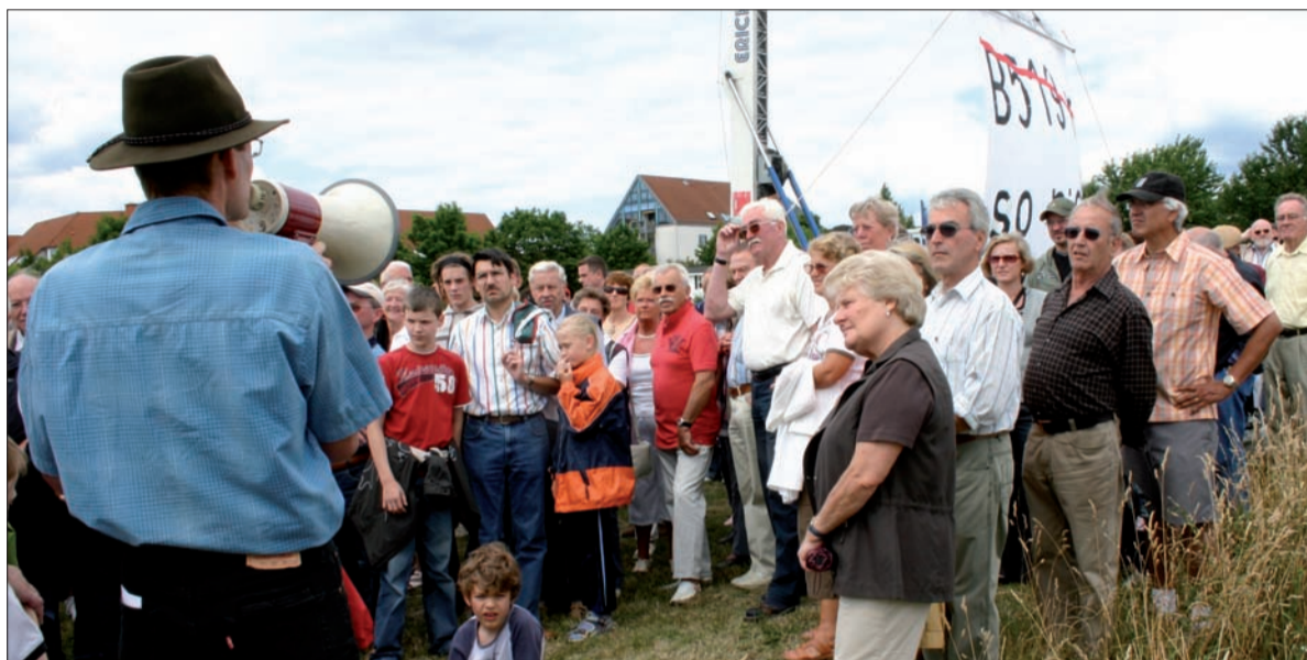
Rund 2.000 Hofheimer und Krifteler Bürger demonstrieren ihren Unmut bei der 1. Trassenbegehung auf dem Krifteler Hochfeld.

Bundesstraße parallel zur Autobahn zusätzlichen (Schwer-)Verkehr anziehen: von der A66, aus Kelkheim, Königstein und Weilbach.