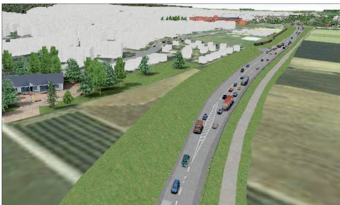
Blick auf den Lärmschutzwall im Bereich Hochfeld Marxheim – Kindergarten „Römerlager“ Frankfurter Straße.

Die Antwort lautet: Hofheim plant ein neues Wohngebiet in Marxheim Süd, für dessen Erschließung eine Straße benötigt wird, die Hofheim dann nicht selbst finanzieren muss. Hierfür scheinen alle Mittel recht zu sein, ungeachtet der demographischen Prognosen für den Main-Taunus-Kreis und der Zweckentfremdung von Bundessteuergeldern. Bleibt dann allerdings noch die Frage: Wer sollte freiwillig in dieses neue Wohngebiet ziehen wollen – direkt neben einer Bundesstraße mit einem Verkehrsaufkommen von ca. 24000 Autos pro Tag und 7% Schwerverkehr?