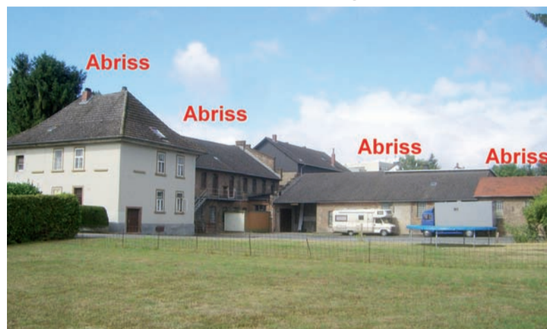
Die Papiermühle: Wohnraum, Arbeitsplatz und Naherholung im Schwarzbachtal sind vom Abriss bedroht.

Diese B 519 neu - so und in dieser Form - braucht niemand, schon gar nicht die Menschen dieser Region !