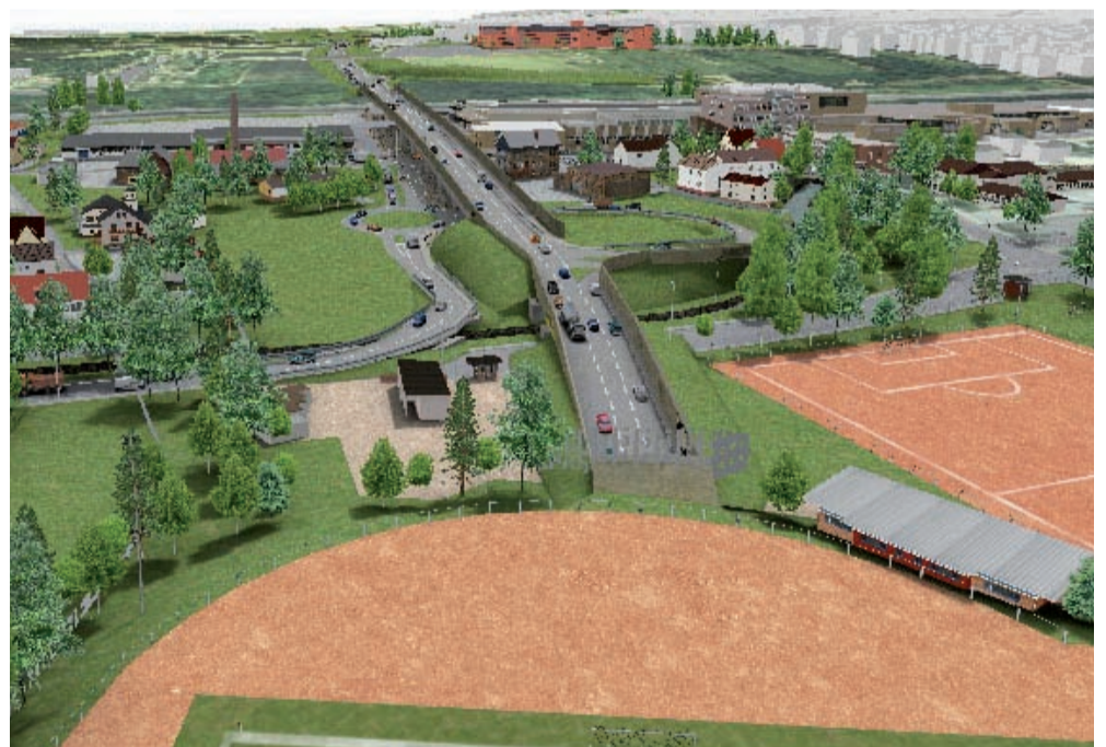
Während der über 2 jährigen Bauzeit ist kein Sport möglich. Nach dem geplanten Bau werden Lärm und Feinstäube unzumutbar für Schulsport und Breitensport.