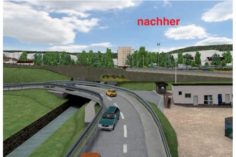
Das geplante Straßenmonster zwischen Sportplatz und Schwarzbach.