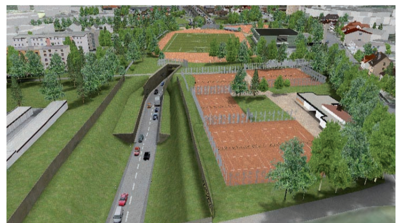
Zukünftig stark verkleinert und mit Emissionen aus dem Straßenverlauf schwer belastet.

und Schmutzbelastung durch die unmittelbar angrenzende Trassenführung und die enormen Beeinträchtigungen während der Jahre andauernden Bauphase außer Acht ließe, wäre damit ein attraktives Freizeit- und ein leistungsorientiertes Sportangebot nicht mehr möglich. In der Konsequenz wird der KTC durch dieses unsinnige Bauvorhaben in seiner Existenz bedroht. Machen Sie sich am besten ein Bild bei der Trassenbegehung am 24.8.2008.