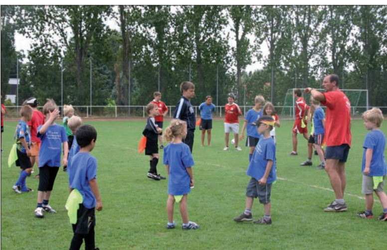
Das Sportplatzgelände vom SV 07 heute ...

tung wohl lieber auf das Krifteler Sportgelände verschieben. Vielen Dank dafür. Der SV 07 hat vollstes Verständnis für die Anliegen der B 519. Leider hat es Hofheim seit Jahrzehnten versäumt, in seiner Stadtentwicklung eine vernünftige Infrastruktur aufzubauen. Jedoch werden mit der geplanten Trassenführung die wirtschaftlichen Interessen der Stadt Hofheim in den Vordergrund gestellt und das auf Kosten der Nachbargemeinde. Es gibt sinnvolle Lösungen, die jedoch die Hofheimer Kassen nicht füllen! Es ist an der Zeit, die Menschen in den Vordergrund zu stellen.