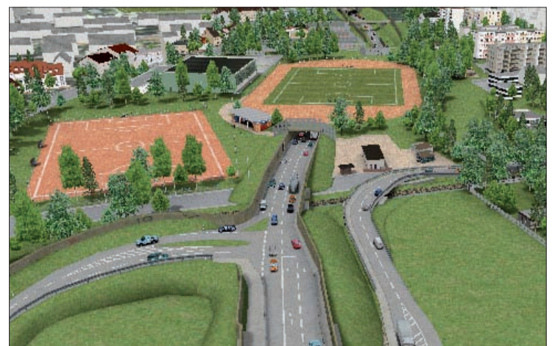
... aus wäre es mit der Idylle!